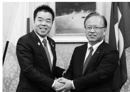
三日月知事と連携して基本構想を推進します